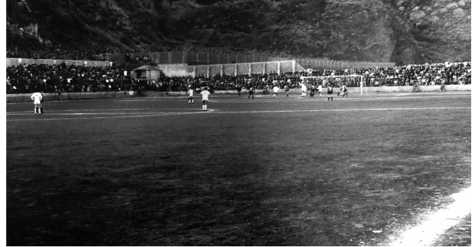
El añorado Campo "Bajamar" en su plenitud